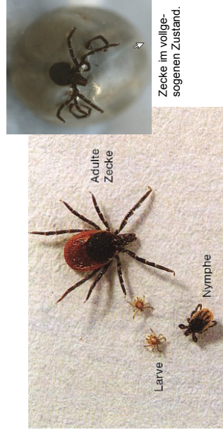
Zecke im vollgesogenen Zustand.